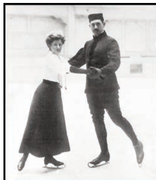
В программе летних Олимпийских игр 1920 г.в