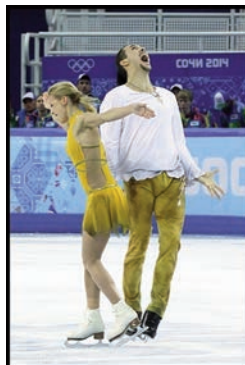
и Татьяна Волосожар с Максимом Траньковым (по 2 золотых медали) (файл 29).

Золотые медали завоевали наши спортсмены и в командных соревнованиях: мужские лыжная и конькобежная эстафеты и командные соревнования по фигурному катанию. В 2017 г. Россия по допинговым основаниям (в основном надуманным и бездоказательным) лишилась 13 медалей на Олимпийских играх в Сочи, переместившись на четвёртое место в медальном зачёте, но в дальнейшем международный спортивный арбитраж удовлетворил часть апелляций российских спортсменов и сборная России вернулась на первое