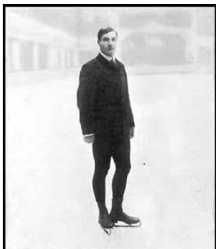
в произвольном катании—россиянин Николай Панин-Коломенкин (файл 2).

Так, с созданием в 1894 г. Международного олимпийского комитета среди прочих видов спорта в будущую олимпийскую программу предлагалось включить и катание на коньках. Тем не менее, на первых трех Олимпийских играх никаких «ледовых» дисциплин не было. Они впервые появились на Олимпиаде 1908 г. в Лондоне: фигуристы соревновались в 4 видах программы. В исполнении обязательных фигур среди мужчин сильнейшим оказался швед Ульрих Сальхов (файл 1),