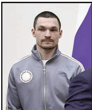
сноубордист Виктор Вайлд (2 золотые медали) (файл 26),