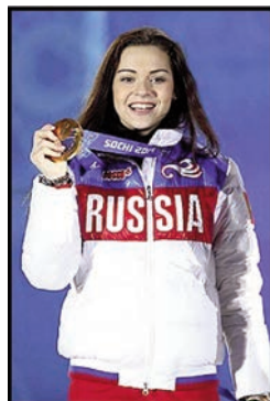
фигуристы Аделина Сотникова (файл 28)