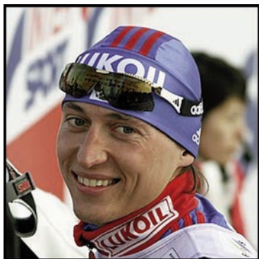
лыжник Александр Легков (файл 24),