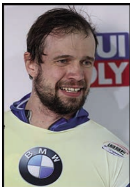
скелетонист Александр Третьяков (файл 25),